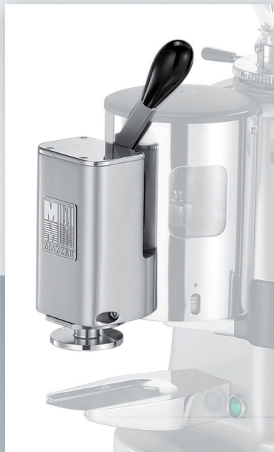
Easy Tamper for doser