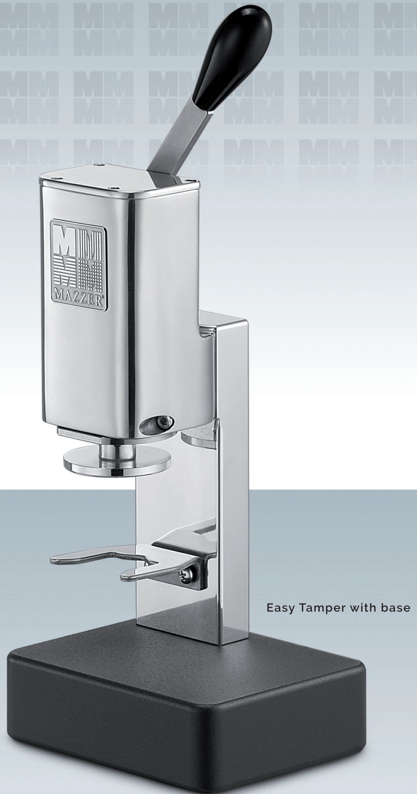
Easy Tamper with base